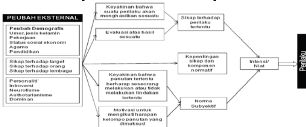
Gambar 6: Model Niat Berperilaku Fishbein

melalui Theory of Reasoned Actions (TRA) yang dikembangkan oleh Martin Fishbein tahun 1975. Teori ini digambarkan dalam suatu model sebagai berikut: